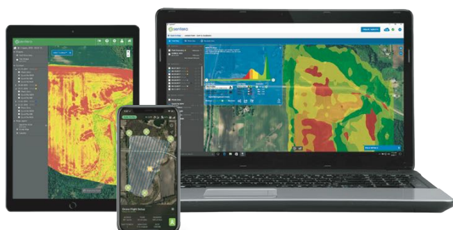
FieldAgent Web, Mobile, e Desktop

La nostra piattaforma FieldAgent è una soluzione completa di analisi dei dati agricoli che è con te ovunque tu sia, in ufficio o sul campo. Associato a un sensore di precisione Sentera, FieldAgent porta oltre la fotografia aerea in prodotti di dati significativi con un valore economico reale, come l'analisi della zona NDVI e NDRE, l'analisi della popolazione, la mappatura delle infestanti e la mappatura di elevazione.